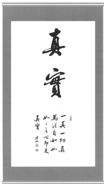
真實 中國佛學院院長 趙樸初