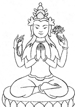
蓮花部寂靜 與忿怒諸尊

報身：(Sambhogakaya) 是由佛以他的智慧功德的成功，是特別為菩薩說法而變現的身形。