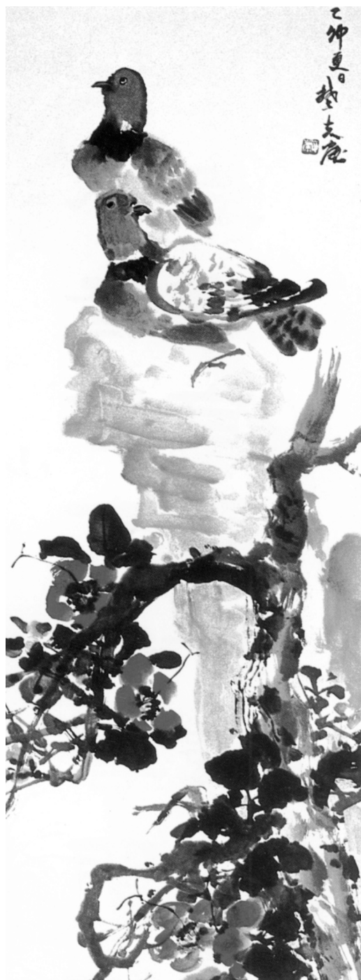
雙鴿 蔡楚夫 (紐約)